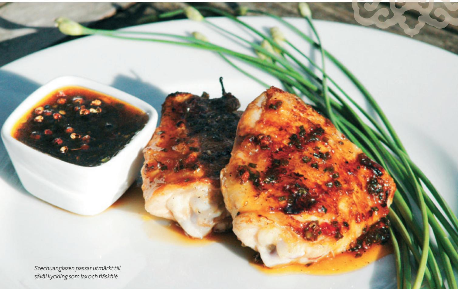
Szechuanglazen passar utmärkt till såväl kyckling som lax och fläskfilé.

Med det här numret av Medartuum Med Mera skickar vi med några fröpåsar med kinesisk gräslök. Den är lika lättodlad och lättanvänd som vår svenska gräslök, men har en liten spännande touch av vitlök i smaken. För att inspirera ytterligare har vi tagit fram några lättlagade och goda sommarrecept med den kinesiska gräslöken som genomgående grön tråd (för den otålige kan den kinesiska gräslöken bytas ut mot vanlig svensk). Lycka till med odling och lagning och glöm inte att gräslöken är flerårig, så du kan klippa härliga gräslöksstrån även nästa år.